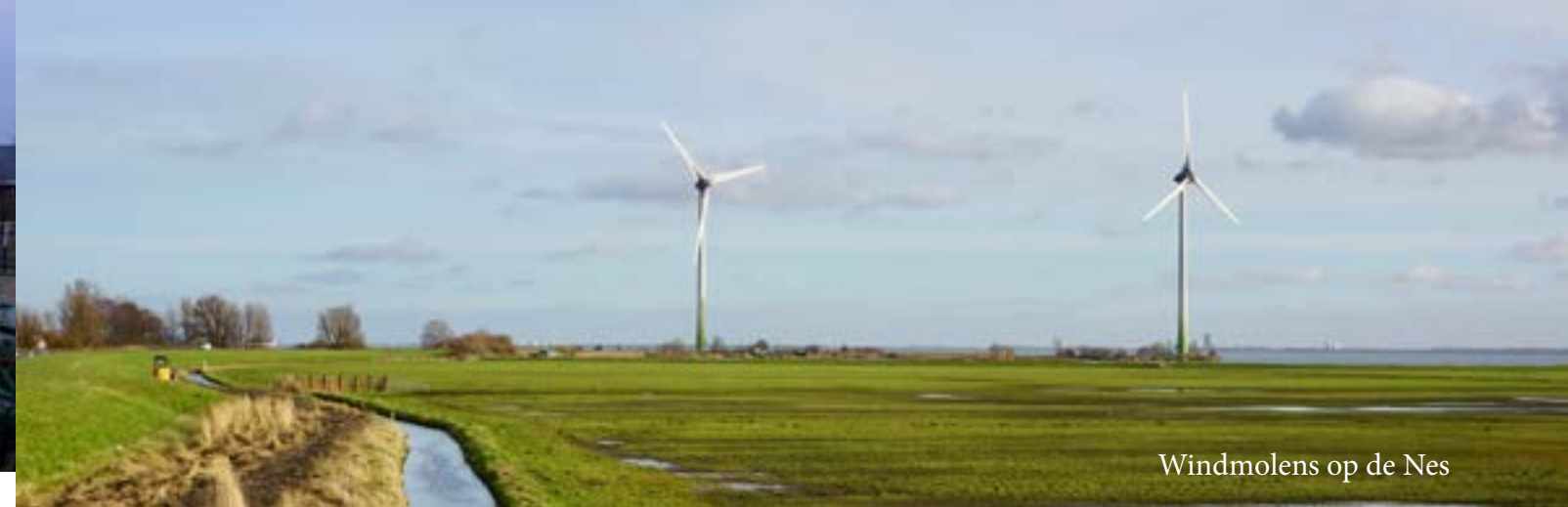
Windmolens op de Nes