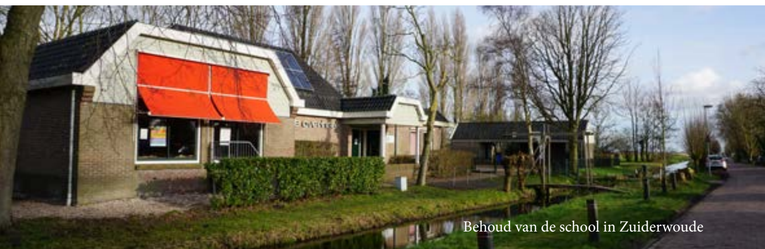
Behoud van de school in Zuiderwoude