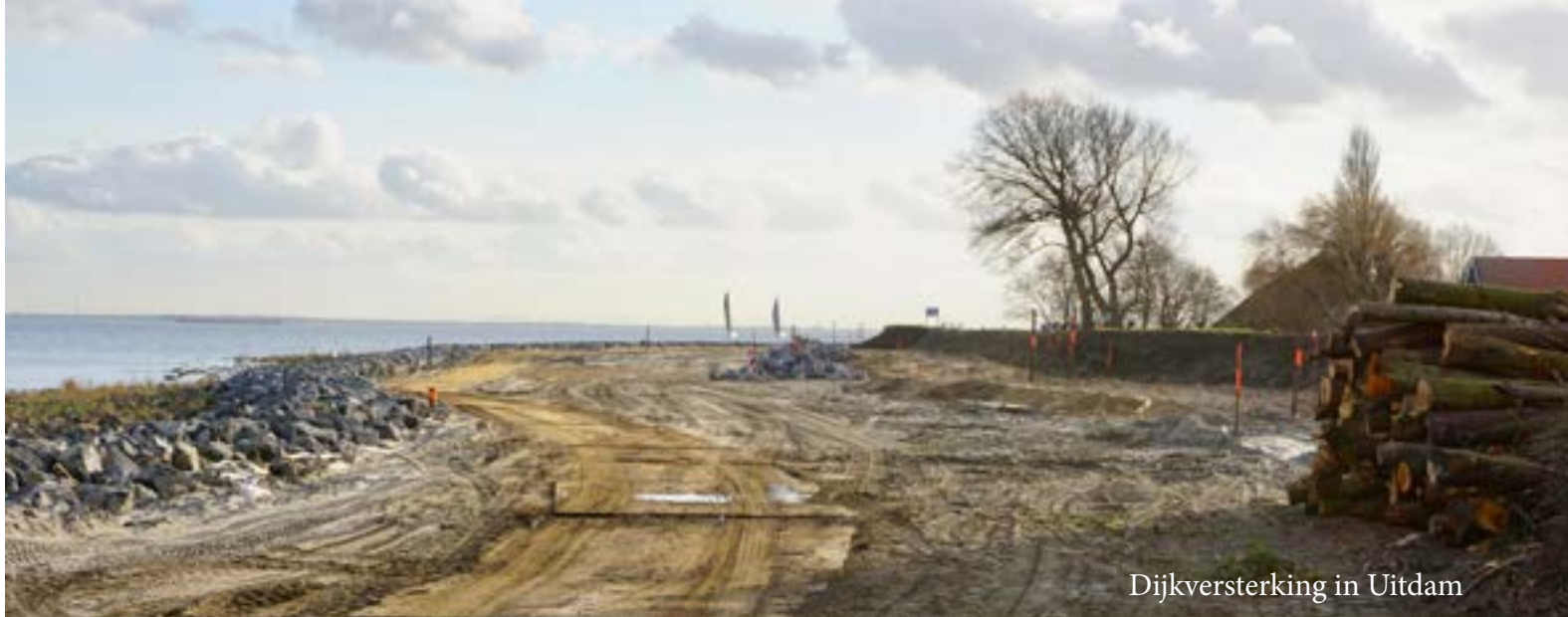
Dijkversterking in Uitdam