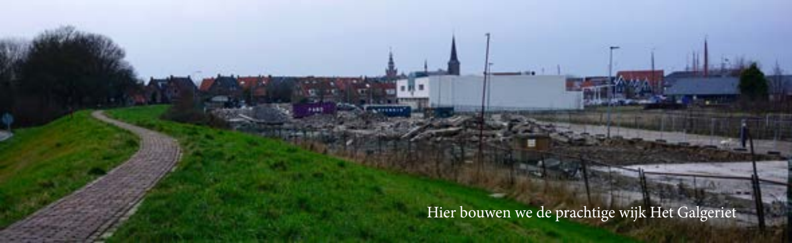
Hier bouwen we de prachtige wijk Het Galgeriet