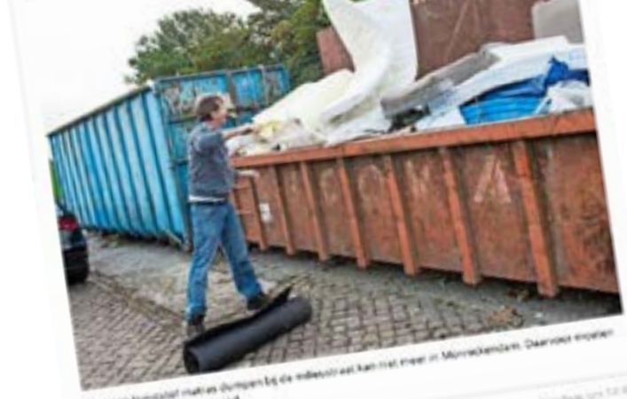
Een milieustraat in Waterland zou een dure grap worden, afvalstoffenheffing zou met minstens vijftig euro omhoog moeten.