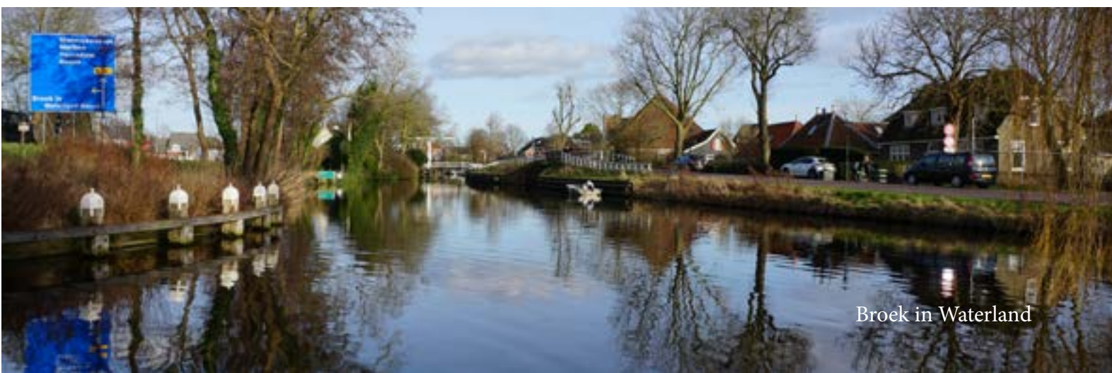
Broek in Waterland

Daarnaast willen wij nog meer samen met de Waterlanders het beleid vormgeven via een beeldvormende raad. Dit is een derde raadsbijeenkomst voorafgaand aan de voorbereidende raad en besluitvormende raad, die er nu zijn. Op zo'n beeldvormende raad nodigen we bewoners, experts en andere betrokkenen uit om hun mening te geven. Dit geeft de raadsleden veel extra informatie voor besluitvorming en verhoogt de betrokkenheid van bewoners. Dit vindt de PvdA Waterland een belangrijk punt en daarom starten we hiermee: