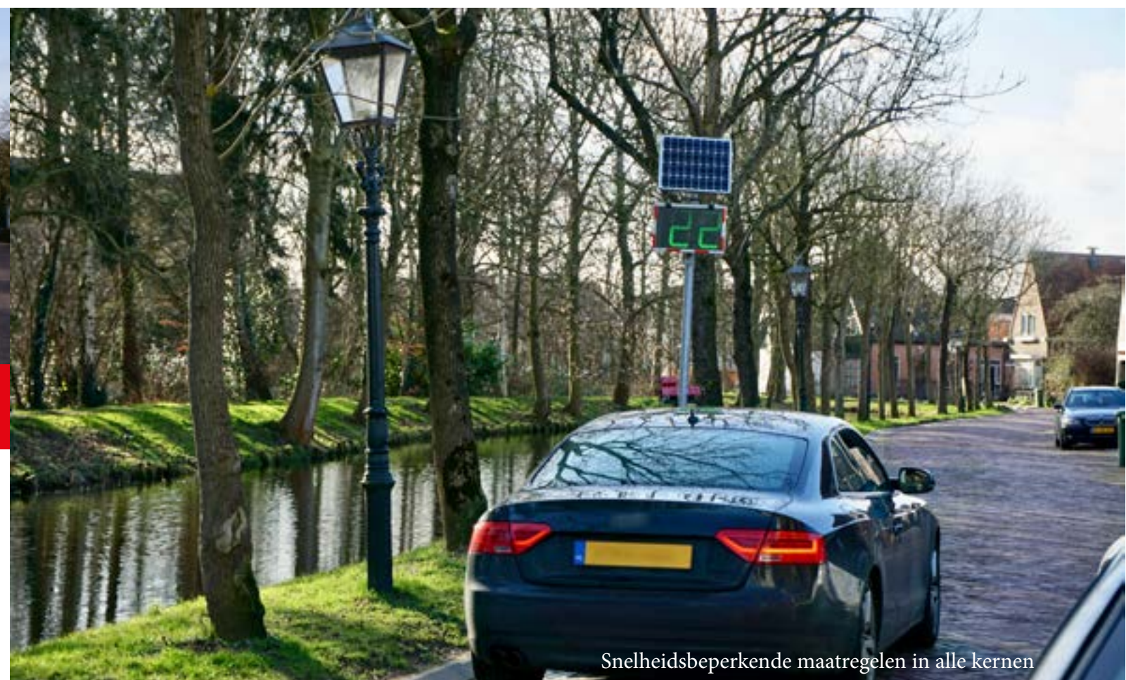
Snelheidsbeperkende maatregelen in alle kernen

Wij zullen alles ondersteunen wat helpt om mensen samen te brengen, de voorzieningen in de kernen zijn daarbij belangrijk. Iedere kern heeft zijn eigen karakter en behoefte, de betrokkenheid van Waterlanders bij hun eigen kern is meestal groot. Maar de afstand tussen burger en politiek is ook groot, en die moet kleiner! Wij maken ons dus hard voor de kernraden, waarbij de gemeente een betrouwbare en duidelijke partner is. Daarnaast willen we het rondje Raad gaat langs de kernen weer in ere herstellen. En uiteraard gaan we ervoor om een beeldvormende raad met bewoners en experts aan tafel in de raad voor elkaar te krijgen.