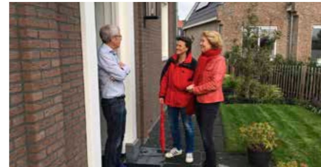
'We willen altijd in gesprek blijven met de burgers'

Uitdam was een prachtig klein dorp. De laatste jaren hebben de problematiek van de dijk en het enorme huisjespark het dorp veranderd. De gemeente heeft hier geen sterke rol gespeeld. Dit willen we veranderen door voor meer bestuurskracht te gaan. Wat wil de PvdA Waterland voor Uitdam? - De eigenaar van het vakantiepark wordt strikt gehouden aan het bestemmingsplan. We accepteren geen pogingen tot oprekken van grenzen of