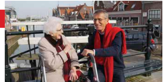
'De zorg is voor ons een van de belangrijkste elementen van aandacht'