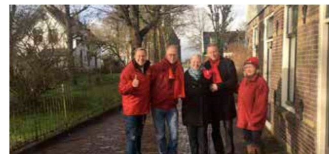
'Zuiderwoude is tevreden, maar niet met het verkeer'

In Ilpendam is veel gebouwd de afgelopen jaren; een woonwijk, een tunnel en een nieuw dorpsplein. We betrekken de actieve en zelfwerkzame Ilpendammers en dus hun wensen altijd bij ons raadswerk. We willen ons in ieder geval gaan richten op: - Verbeteren van straatverlichting en bevorderen van internetbereik. - Nieuwe woningbouw ook voor jongeren en senioren op meer dan het oude Sebastianus-terrein, maar niet in het groen. - Het oplossen van problemen met het 'forens-parkeren'.