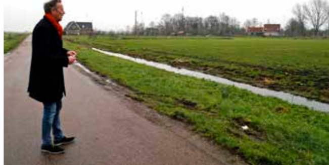
'Wij willen veel bouwen, bijvoorbeeld hier in Broek'

zoals verblijfs- en plattelandsrecreatie, B&B's. - De onderdoorgang Broek ligt niet binnen de verantwoordelijkheid van de gemeente. Wij hebben dit proces actief onder de aandacht gebracht bij onze Statenfractie, omdat wij het een schitterend voorbeeld vinden van burgerparticipatie, waaraan wij onze steun willen geven.