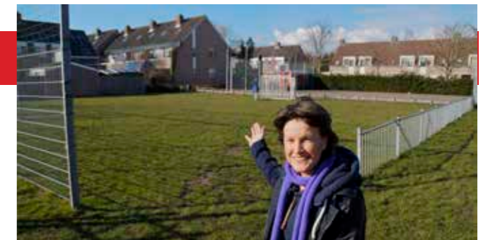
'Het opknappen van het trapveldje moet snel gebeuren'

Katwoude moet wat ons betreft ook blijven zoals het is. Ook hier geldt wat wij voor heel Waterland vinden: kleinschalige initiatieven die deze schoonheid niet ondermijnen, zoals een theetuin, strandtent of kanoverhuurbedrijf, stimuleren wij. Wij willen een veilig fietspad langs de N235 en een goede oplossing voor de herinrichting van weg en kruispunt.