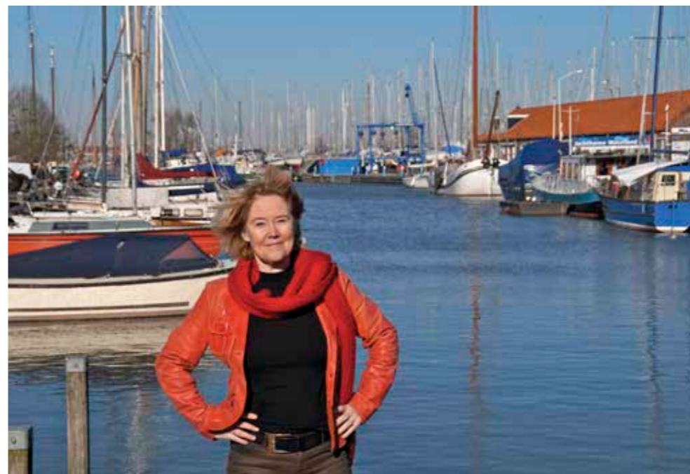
‘Wij willen vooral woningen bouwen op het Galgeriet’