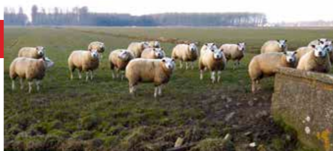
'Nee, niet bouwen in de Purmer'

Ook Overleek en de Purmer willen wij open houden. Wij willen ons landschap delen met de plaatsen om ons heen, die ervan mogen meegenieten voor recreatie. Wij zullen niet toestaan dat Purmerend bouwt in de Purmer.