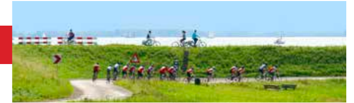
'Wij zijn voor recreatie, maar wel kleinschalig'

afspraken. Geen meter extra bebouwing dus. - Een snelle verplaatsing van de oprit richting Monnickendam. - Effectieve controle op de snelheid van het doorgaande gemotoriseerde verkeer.