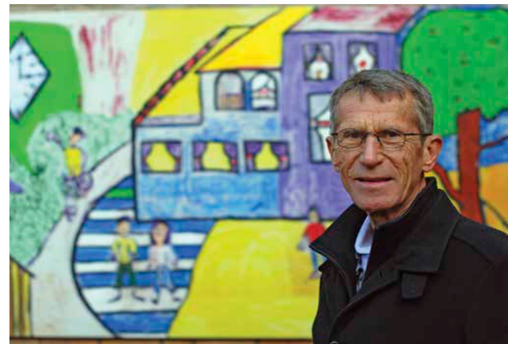
'Ieder kind heeft recht op goed onderwijs, dus daar moeten wij voor zorgen'

Bij leven en welzijn, ik hoop dat we aan alle mensen in onze gemeente aandacht hebben besteed. Er zijn woningen gebouwd, ook kleine woningen voor alleenstaande starters, ook appartementen voor ouderen, het Galgeriet wordt een nieuwe woonwijk. We hebben onze waarde van groene gemeente behouden met de grote steden om ons heen. En, zoals ik zeg in mijn sport: prestatie en plezier telt ook in de politiek.