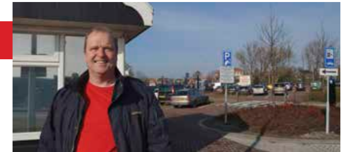
'Parkeren op Marken moet beter geregeld worden'